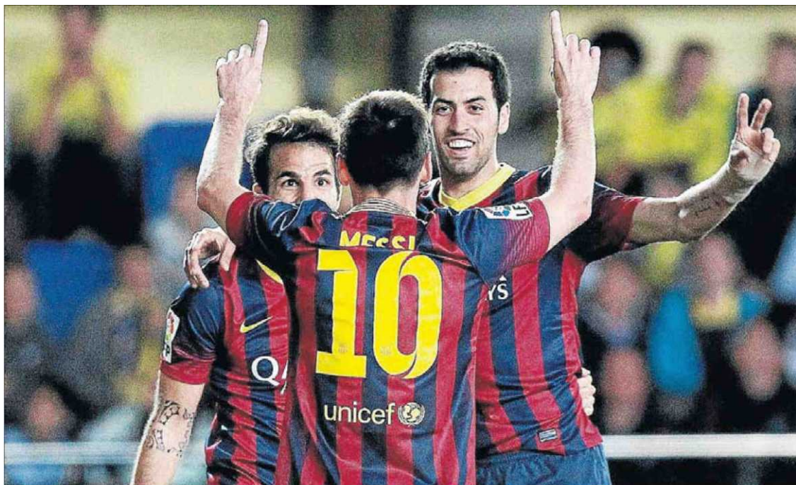
Messi celebra un tanto señalando el cielo, en recuerdo de su abuela.